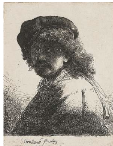
Rembrandt Autoportrait, 1653 Gravure, pointe sèche et eau-forte. 13 x 10,6 cm